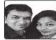
બ.સી. બોપા - બીબી

નીલમ ફેશન, ગાલા ઈન્સ્ટિટ્યુટ ૬૬૬૨ મોલ, સ્ટેશન સામે (બોરીવલી - વેસ્ટ)